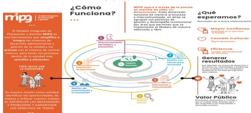
Gráfico No. 1